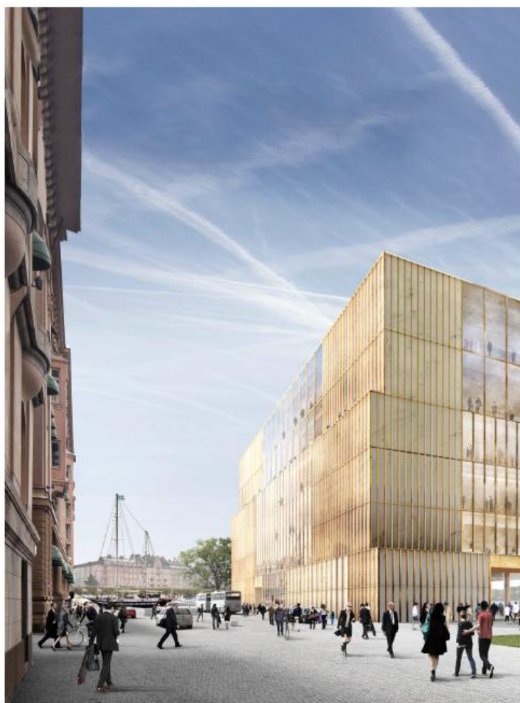
Mot Hovslagargatan föreslås ett nytt torg där angöring till byggnaden kan ske. Även rampen till garaget placeras på torget. Bild: David Chipperfield Architects.