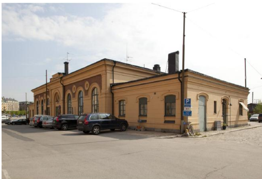
Tullhusets norra fasad med tidstypiska rundbågar och putsomfattningar vid fönster och dörrar. Foto IJ, SSMDIG012787.