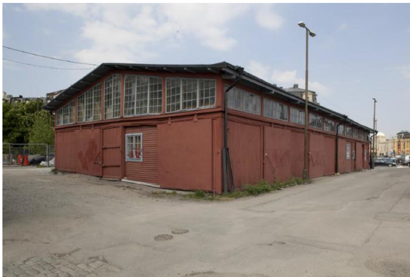
Varuskjulen från 1910 har i huvudsak kvar sin ursprungliga utformning med panelklädda väggar, stora skjutdörrar, småspröjsade överljusfönster och dekorativt utformade takstolstassar. Fönstren i det nedre partiet är dock mer sentida. Under asfalten skimtar en äldre markbeläggning av sten. Foto IJ, SSMDIG012798.