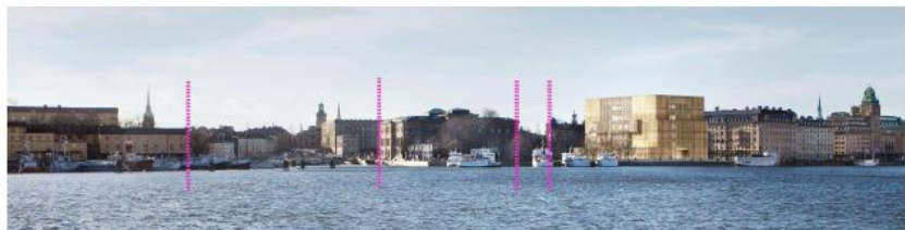
Figur 20. Genomsiktighet från Galärvarvet.