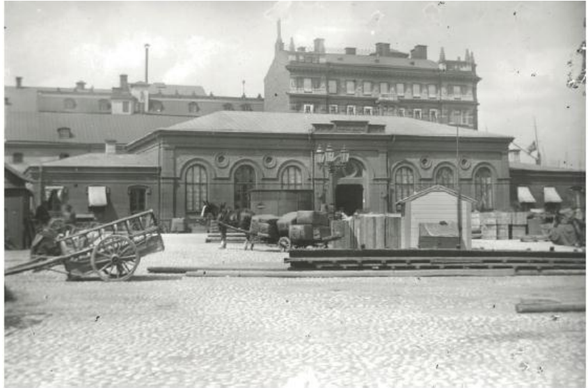
Tullhuset på Blasieholmen omkring 1900.

många inslag. Museiparken, som har kvar stora delar av sin ursprungliga struktur och karaktär, visar på stadens ambitioner i slutet av 1800-talet att skapa offentliga parker och grönska i staden.