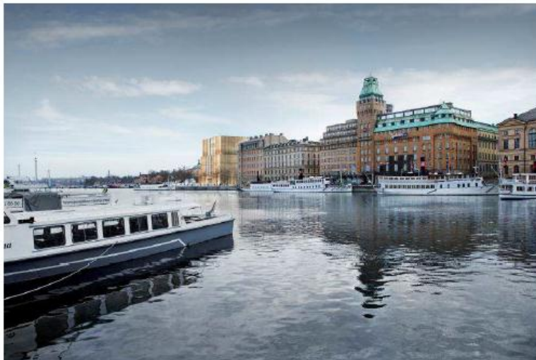
Vy från Nybroviken mot Blasieholmsudden och Nobel Center. Bild: David Chipperfield Architects.