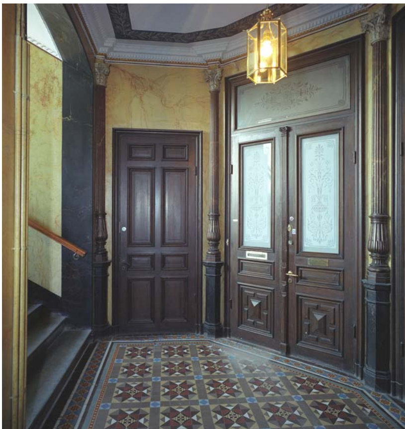
Golvbeläggning av tiles, keramiska plattor från 1889. Marmoreringsmålade väggar och träådtrade dörrar med etsat mönster i glasrutorna. Östermalm.

Vid en renovering finns många saker att överväga varje byggnad är unik och har olika förutsättningar.