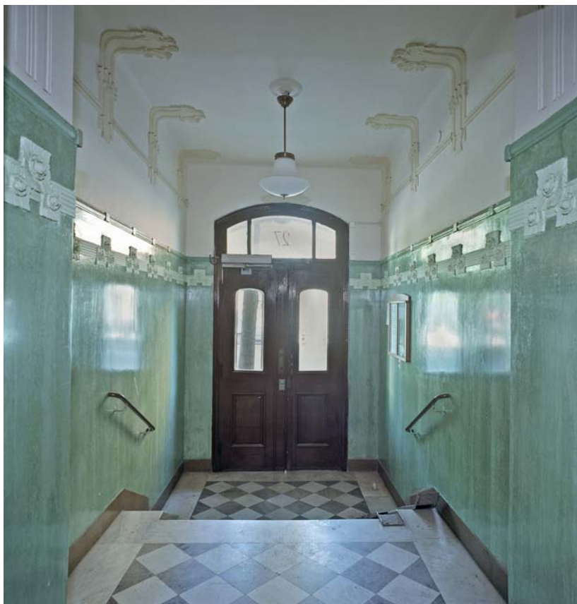
En entré i jugendstil. Kungsholmen.

rankor, riddare och troll skapade en sagostämning i entrérummen. Dekoren samverkade med massiva, ofta speciellt formgivna, lägenhetsdörrar i mörkbetsad ek.