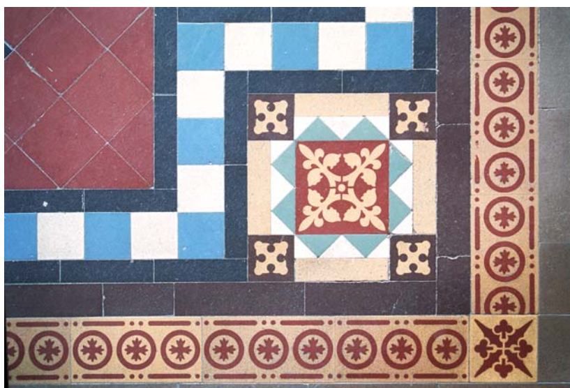
Golvbeläggning av tiles, keramiska plattor, från 1889. Nyttillverkade plattor finns att köpa för eventuella kompletteringar. Östermalm.

Det vanligaste under 1930-talet var ändå att måla väggarna enfärgat i en mycket blekt gulbeige ton och med högblank yta så att ljuset spreds in i trapphuset. Fortfarande var lägenhetsdörrarna