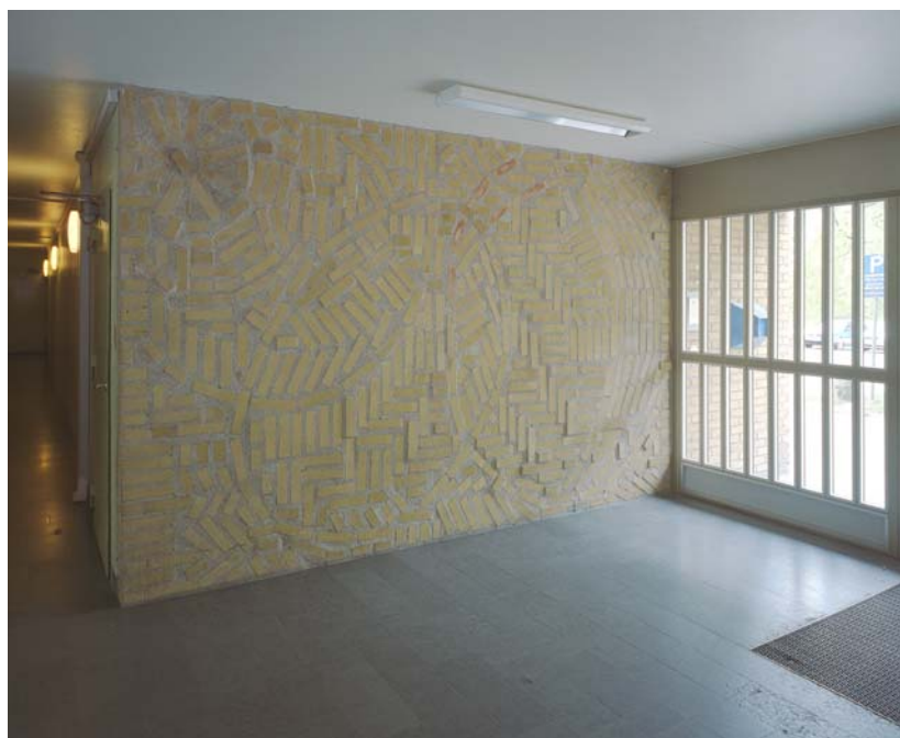
Bredäng, 1960-tal.

kulörer, hör till tidens karaktärsdrag. Omtänksamma byggherrar kostade på äkta stenmaterial på väggarna, ofta polerad travertin, och försåg hyreshusens entréer med väggfasta konstverk i t.ex. keramik eller tegel. Tyvärr finns p.g.a. regelbunden ommålning inte mycket kvar av senare decenniernas målningsdekor.