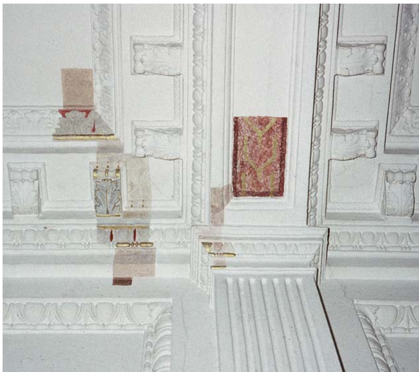
Under dagens enfärgade ytskikt kan det döljas en spännande dekor. Huset är byggt 1886. Östermalm.