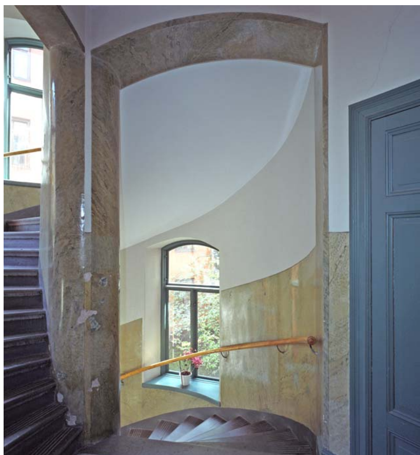
Ett enklare trapphus med karaktär från byggnadstiden 1898. Södermalm.

Det är stor skillnad på utförande i olika delar av staden. Vid Strandvägen och esplanaderna eller kring Citys affärsstråk finns de mest påkostade inredningarna där de