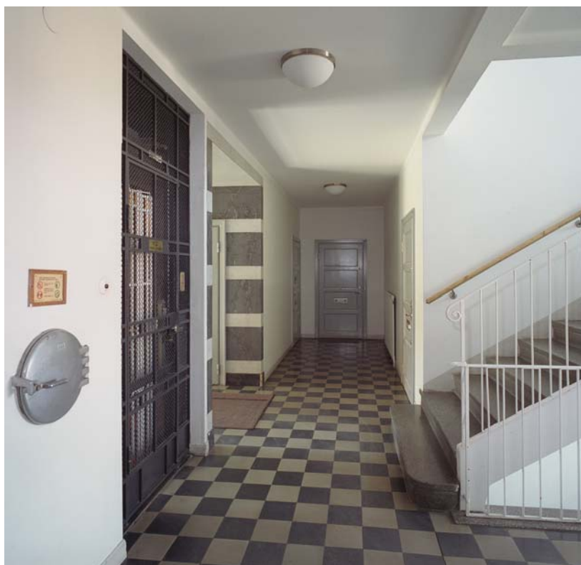
Hiss och sopnedkast är här självklara inslag. Huset är byggt 1930–32 av HSB. Södermalm.

Bostadshusen från 1960- och 70-talen har ofta enkelt enfärgade väggar. Ibland var det meningen att hissen skulle vara