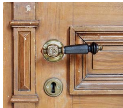
Lägenhetsdörr och dörrhandtag från 1889. Södermalm.

Trappräckets väggfästen, dörrhandtag, ringlockor, namnskyltar, brevinkast och armaturer ingår i trapphusets helhetsmiljö. Idag finns reservdelar i olika stilar att