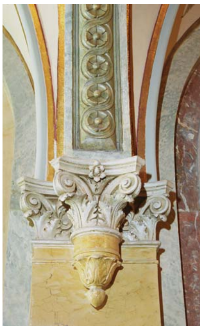
Detalj av målad stuck. Huset är byggt 1890. Östermalm.

Ett visst slitage bör man kunna acceptera och uppskatta som patina.