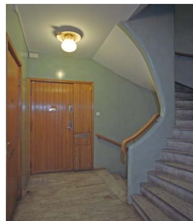
Ett hus byggt 1944–46. Östermalm.