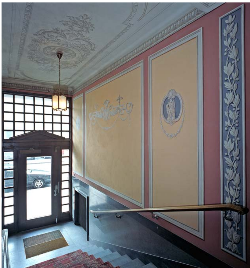
Huset byggdes 1930 med en entré målad i en eftersläpande 20-talsstil, signerat av Jöns Thulin. Kungsholmen.

Under de sista åren på 1890-talet skedde övergången till den nya tidens stil, jugendstilen, som helt övergav de klassiska formerna för att istället skapa en rikt böljande inhemsk, eller åtminstone europeisk, flora och fauna. Nu avbildades vallmoblommor, rosor, tulpaner, liljor, maskrosor och eklöv liksom harar, ekorrar och humlor både i portomfattningarnas stendekor och i entréernas målade bårder och stuck. Ljusa kulörer användes. Jugendstilen var förhärskande fram till omkring 1910 då den nationalromantiska andan skapade en rik och fantasifull dekor av helt annat slag. Ytäckande dekorslingor med växt-